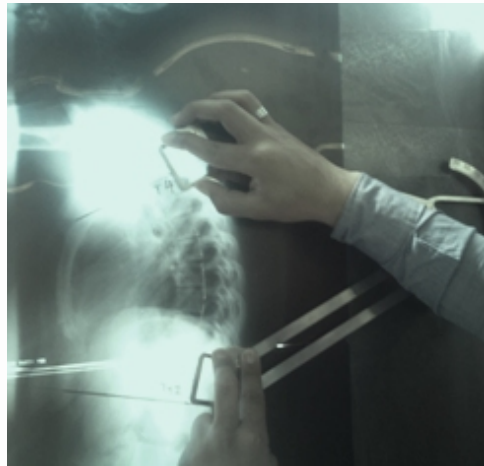
شکل ۳. اندازه گیری کایفوز سینه ای به وسیله کایفومتر از روی عکس رادیوگرافی

در انتها برای اندازه گیری کایفوز سینه ای به وسیله کایفومتر از روی عکس رادیوگرافی با استفاده از ماژیک سفید رنگ مسیر جسم مهره ای مهره های T4 تا T12 که سطح فوقانی و تحتانی این دو نقطه در اندازه گیری به روش کوب مشخص شده بود، رسم گردید. سپس آزمونگر به گونه ای در کنار عکس رادیوگرافی قرار