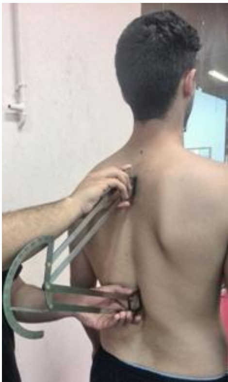
شکل ۲. اندازه گیری کایفوز سینه ای به وسیله کایفومتر

آزمونگر به گونه ای که بتواند به راحتی اندازه گیری را انجام دهد، در پشت نمونه قرار گرفته و بلوک های کایفومتر را روی زوایه خاری مورد نظر قرار می دهد و میزان درجه را ثبت می کند. اندازه گیری ها به صورت یک سویه کور ۱ انجام شد و هر اندازه گیری سه مرتبه انجام و میانگین آن به عنوان درجه کایفوز هر فرد در نظر گرفته شد. فاصله بین هر اندازه گیری ۳ دقیقه بود (گریندال و دیگران، ۲۰۱۱؛ گریندال و دیگران، ۲۰۰۹؛ لاندون و دیگران، ۱۹۹۸).